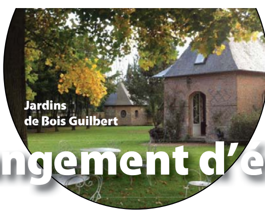
Jardins de Bois Guilbert